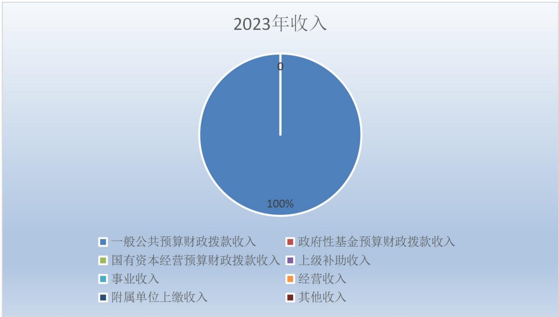
图 1. 收入决算图

内蒙古自治区卫生健康委员会（本级） 2023 年度本年支出决算合计 8,797.23 万元，其中：